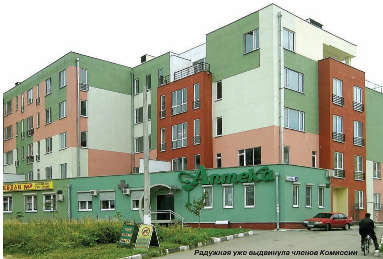
Радужная уже выдвинула членов Комиссии